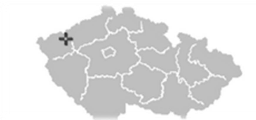
Obrázek 2: Poloha Obce Stráž nad Ohří

Obec Stráž nad Ohří se nachází v Karlovarském kraji, v nejseverovýchodnější části okresu Karlovy Vary, necelých 9 km severovýchodně od Ostrova (viz obrázek č. 2).