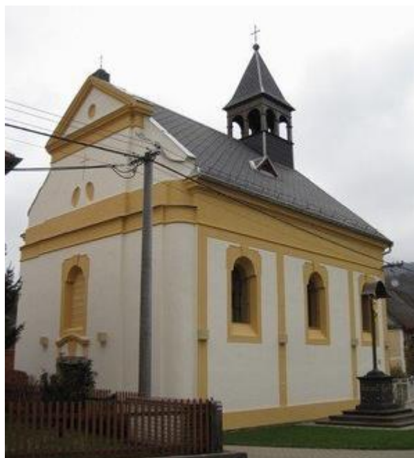
Obrázek 7: kostel sv. Michaela Archanděla