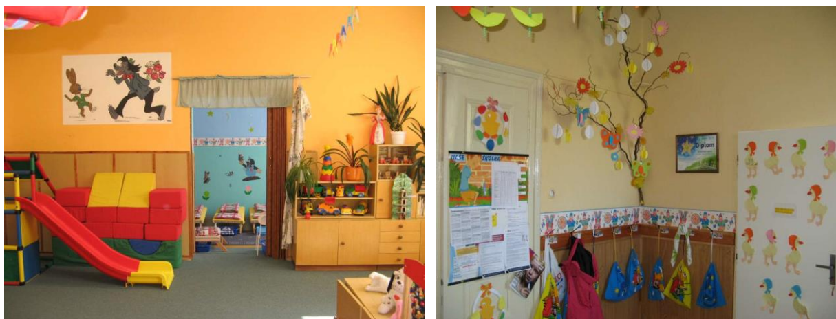
Obrázek 4: Prostory MŠ II. (zdroj: http://www.msstraz.estranky.cz )

Obrázek 3: Prostory MŠ I. (zdroj: http://www.msstraz.estranky.cz )