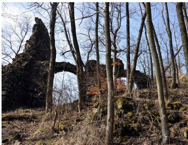
Obrázek 6: Zřícenina hradu Himlštejn

Na území obce Stráž nad Ohří se nenachází žádná památková rezervace, památková zóna ani ochranné pásmo nemovité kulturní památky. 18 Turisty do oblasti láká několik nemovitých kulturních památek, mezi něž patří zřícenina hradu Himlštejn, kostel sv. Michaela Archanděla a litinový kříž, sousoší Nejsvětější Trojice a selský statek v osadě Malý Hrzín. V obci Boč vede přes řeku zajímavý závěsný most. Do budoucna je nutné přistoupit k opravě místních hřbitovů, kostela sv. Michaela a kaple Osvinov.